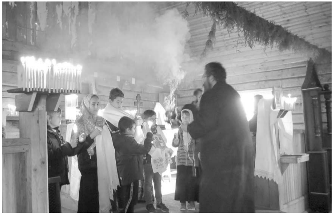
Sentikiai perduoda tradicijas: jų vaikai ir anūkai kantriai dalyvauja pamaldose. Jie ir gieda, ir dalyvauja eisenoje aplink cerkvę. Pamaldos vyksta senąja bažnytine slavų kalba, išlaikant senąsias skaitymo ir giedojimo tradicijas.

„Tai mūsų Švenčiausiosios Mergelės Marijos Užtarėjos („Pokrov Presviatoj Bogorodicy“) šventė, švenčiama pagal senąjį kalendorių spalio 14 dieną. Dievo motiną užtarėją X-ame amžiuje pamatė tik du žmonės. Šventė pagal cerkvės kanonus nėra kažkuo itin ypatinga, bet pagal žmonių meilę ir skiriamą dėmesį – tikrai svarbi.