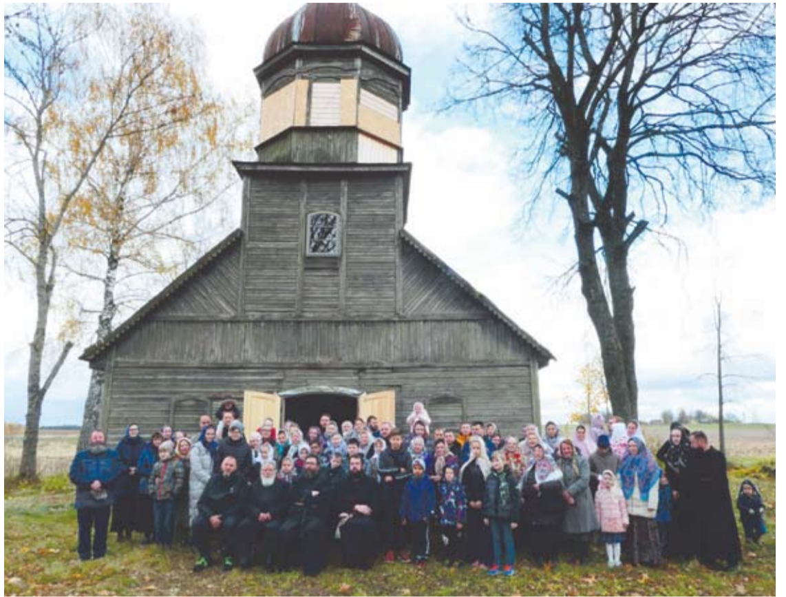
Mišioms pasibaigus, Girelės cerkvės durys užrakinamos ilgam, gal net iki kitų metų spalio (jei nevyks tvarkybos darbai). Spalį sentikiai vėl tradiciškai suvažiuos į pamaldas.