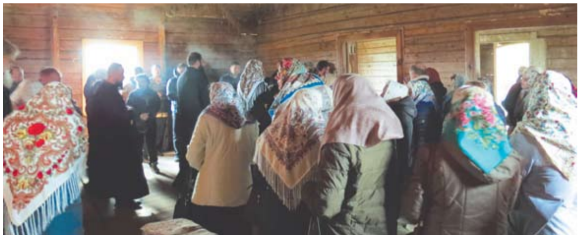
Sentikių moterys į cerkvę įeina tik ryšėdamos skaras - didesnes, platesnes, dažnai gėlėtas, dengiančias daugiau kūno. Moterys stovi kairėje pusėje, vyrai – dešinėje.